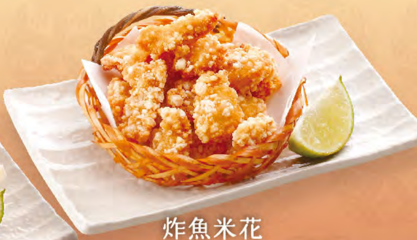
炸魚米花 プチ魚から揚げ 100元