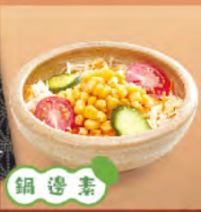
鍋邊素 玉米沙拉 50元 コーンサラダ