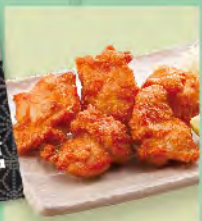
和風雞唐揚 100元 鶏からあげ