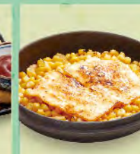
焗烤玉米 80元 チーズコーン