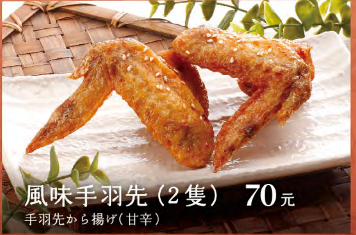
風味手羽先 (2隻) 70元 手羽先から揚げ(甘辛)