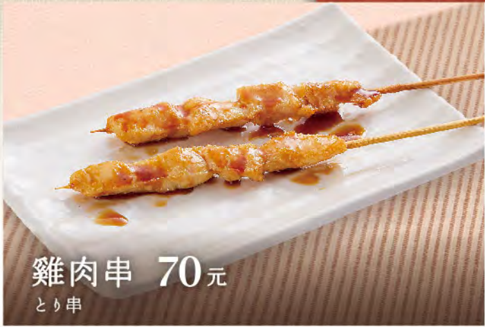
雞肉串 70元 とり串