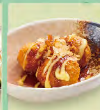
章魚燒 60元 たこ焼き