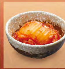
泡菜 15元 キムチ