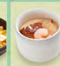
茶碗蒸 40元 茶碗蒸し