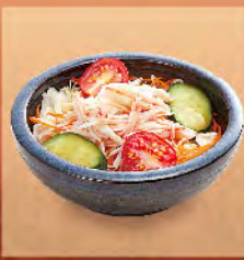
蟹味棒沙拉 50元 カニカマサラダ