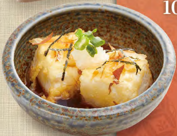
揚出豆腐 40元 揚げ出し豆腐