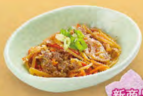
牛肉炒牛蒡 40元 牛キンピラごぼう