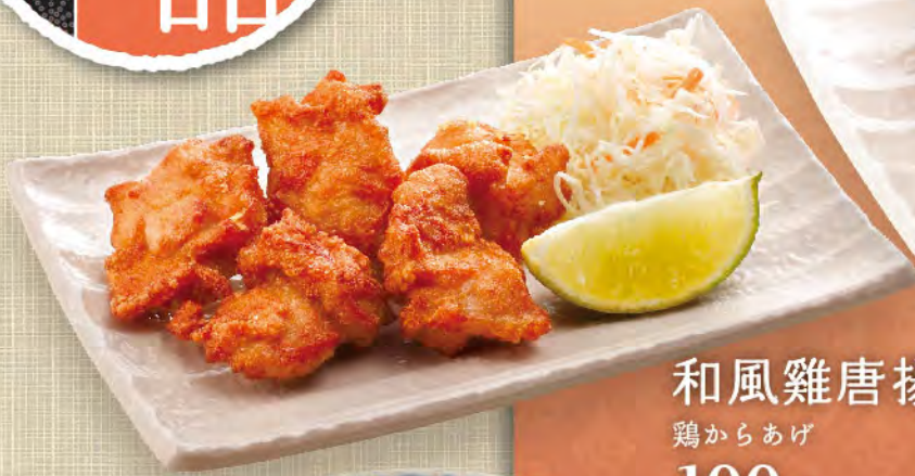
和風雞唐揚 鶏からあげ 100元