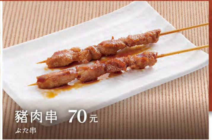
豬肉串 70元 ふた串