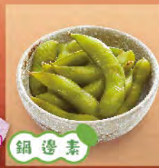
鍋邊素 毛豆 15元 枝豆