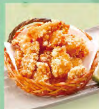
炸魚米花 100元 ブチ魚から揚げ