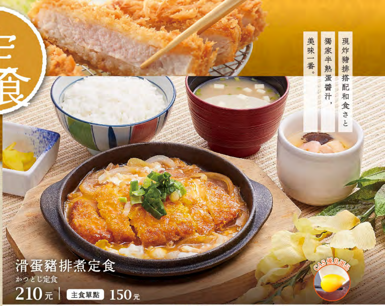
滑蛋豬排煮定食 かつとし定食 210元 | 主食單點 150元