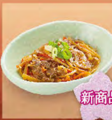
新商品 牛肉炒牛蒡 40元 牛キンピラごぼう