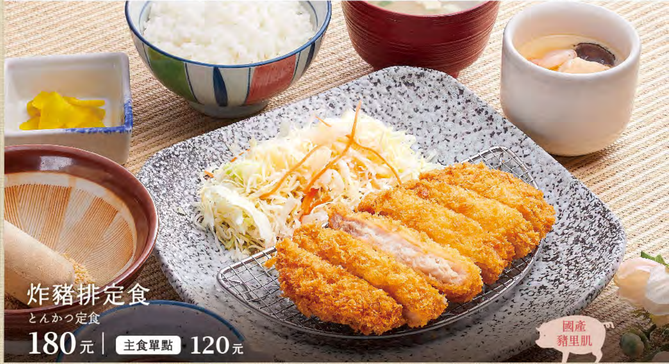
炸豬排定食 とんかつ定食 180元 | 主食單點 120元