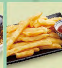
黃金薯條 60元 フライドポテト