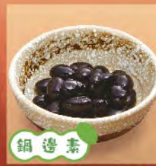
鍋邊素 佃煮黑豆 15元 黑豆煮