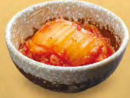
泡菜 15元 キムチ