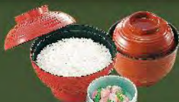
白飯+味噌湯 50. TAKE OUT ご飯+味噌汁セット