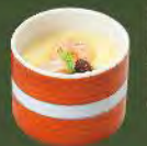
茶碗蒸 40. 茶碗蒸し