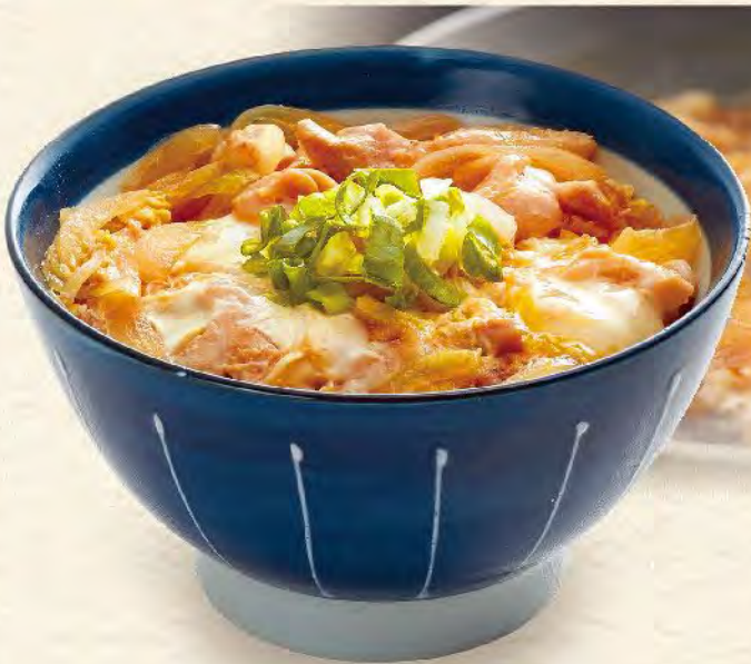
親子丼 親子丼 138元