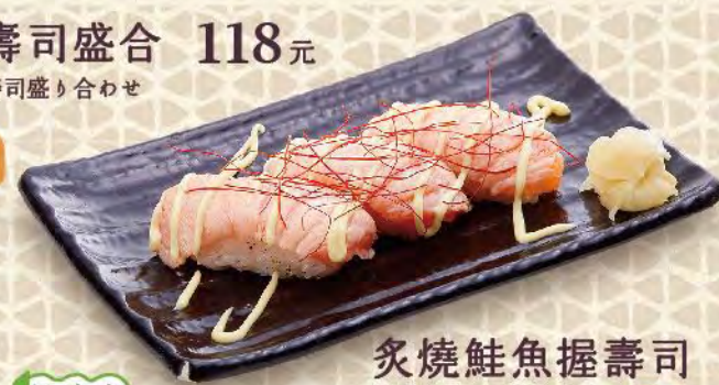
握壽司盛合 118元 握り寿司盛り合わせ