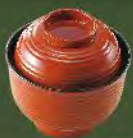
味噌湯 30. TAKE OUT 味噌汁