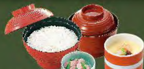
白飯+味噌湯+茶碗蒸 80. ご飯+味噌汁+茶碗蒸しセット